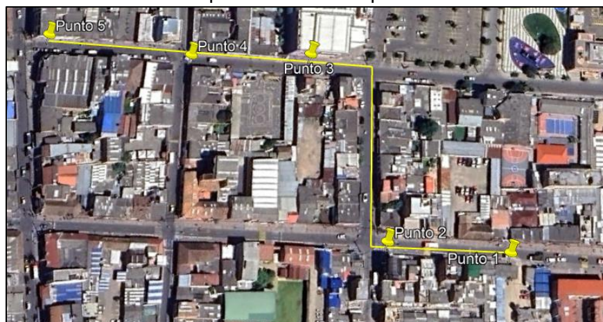
Ilustración 1. Recorrido

Se realizó recorrido de control y vigilancia en el cuadrante 4, barrio CENTRO el día 12 de junio del 2024, desde las coordenadas 4°42'59.077"N-74°12'30.524"W hasta las coordenadas 4°42'59.306"N- 74°12'39.492"W (ver ilustración 1. Ruta amarilla), con el fin de verificar las condiciones ambientales, identificar posibles afectaciones a los recursos naturales y realizar las acciones de prevención correspondientes.